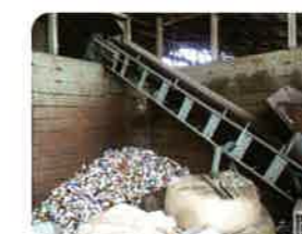
アルミ回収プラント