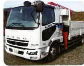
普通ユニック車 3台