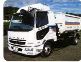
アームロール車 4台

○運搬品目:特管物(アスベスト)、廃プラ、廃油、廃酸、廃アルカリ、汚泥、動植物性残渣、金属くず、繊維くず、ガラス及び陶磁器くず、紙くず、瓦礫類、木くず、建設廃材