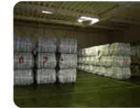
ペール品ストックヤード